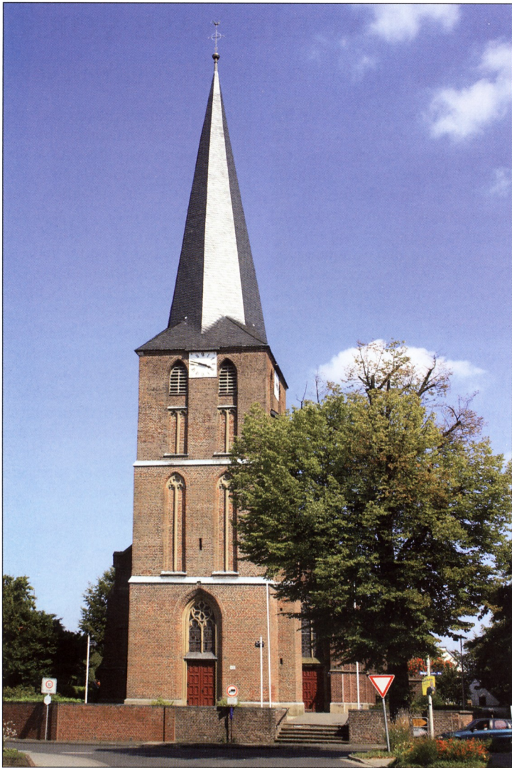
Leuth, Pfarrkirche. Bei der Leuther Pfarrkirche handelt es sich um eine in der 2. Hälfte des 15. Jahrhunderts und 1860/ 61 errichtete dreischiffige neugotische Backstein-Hallenkirche mit po-

lygonalem Chor, Seitenkapellen und vorgesetztem Westturm (2. Hälfte 15. Jahrhundert); die alte Ausstattung ist erhalten. Auf dem Kirchhof befindet sich ein Sandsteinkreuz von 1712.