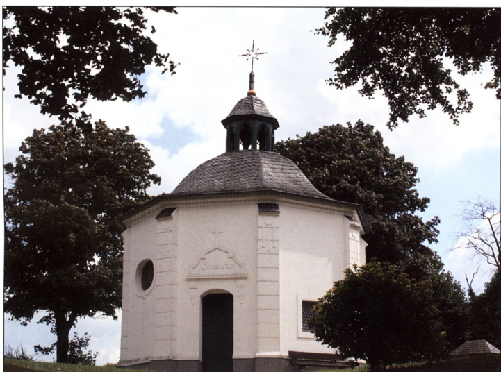
Hinsbeck, Kreuzkapelle. Vor 1731; oktogonaler Putzbau mit flacher Holzdecke und ovalen Fenstern, Haubendach mit neu-

lygonalem Chor, Seitenkapellen und vorgesetztem Westturm (2. Hälfte 15. Jahrhundert); die alte Ausstattung ist erhalten. Auf dem Kirchhof befindet sich ein Sandsteinkreuz von 1712.